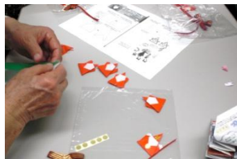
折紙でサンタを折って