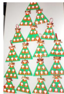
たくさんのツリーの完成です