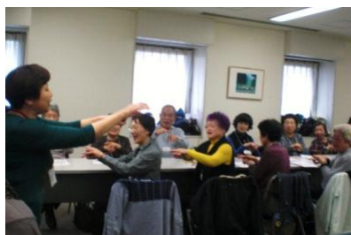
グーチョキパーで 何作ろう の手遊び