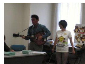
Gさんのギターも7年 目。歌う楽しさアップ。