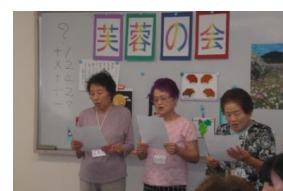
Gさん、Tさん、Kさんの また逢いましょうお元気で