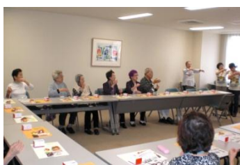
手のひらを太陽に等を手話で