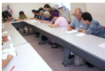
協力して問題にチャレンジ