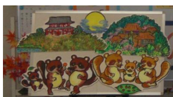
パネルシアター 浅草たぬき通りのお話