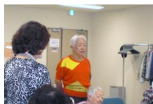
Yさんの長唄 松の緑