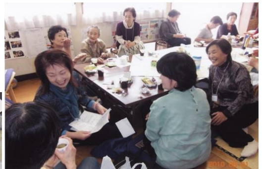
ティータイム 和やかに談笑