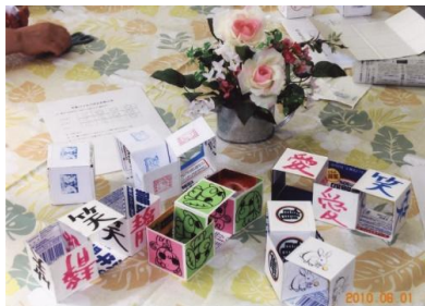
全面揃えてサイコロに組立