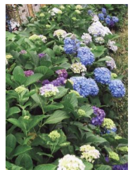
会館周辺の紫陽花