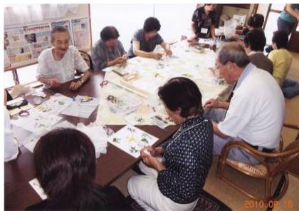
すてきな作品ができそう