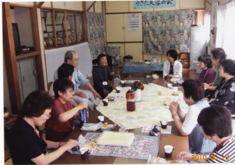
Tさん生い立ちを語る