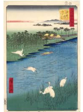
逆井の渡し「昔のイメージ」