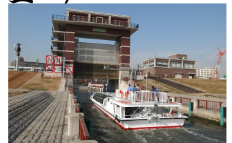
荒川ロックゲート

【ホームページ】 http://edogawaguide.web.fc2.com/