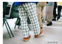
片足上げ左右各1分を1日3回でウォーキング1時間に相当するとか早速、全員で片足上げ!