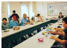
ゆったりとお茶の時間を楽しみました