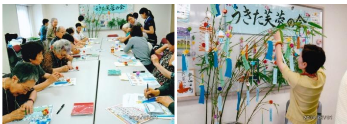
心をこめて短冊に願いを きれいな笹飾りの完成です