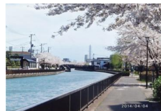
今年の新川沿いの桜