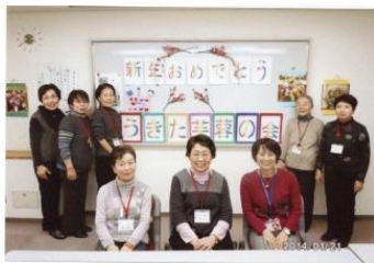
本年もどうぞよろしくお願ひ致します。(スタッフ一同)