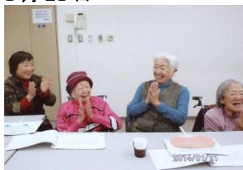
素敵なお笑顔と手拍子で歌います