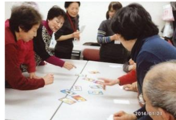
童心に返って福笑い、トランプ、かるたとり。