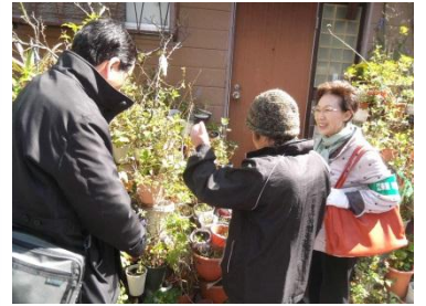
なんという花ですか？

今後とも江戸川みまもり隊一同初心を忘れず、日々の地道な活動を仲間とともに、一生懸命努力していきますので、どうぞよろしくお願い申し上げます。 江戸川みまもり隊一同