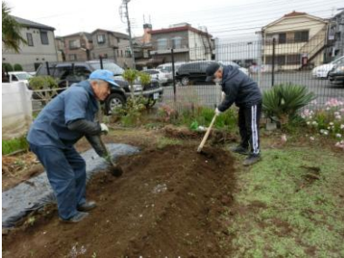
畝作り後継者が出来たようです