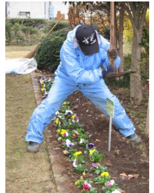
看板を立てたら花壇コンクールみたいです