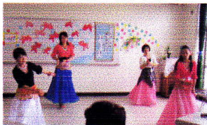
リズムカルなポリウッドダンス♪