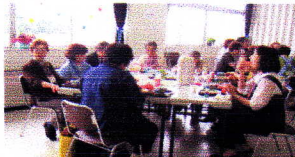
思わず食が進みます