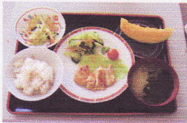
抜群にさわやか献立