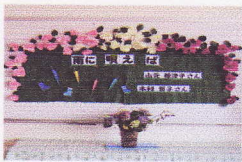
バラの香りで雨を..