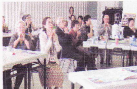
毎日やりたいです