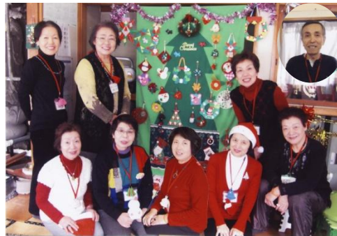
芙蓉の会スタッフ一同