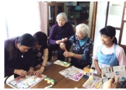
12 月 クリスマスのかざりを作り