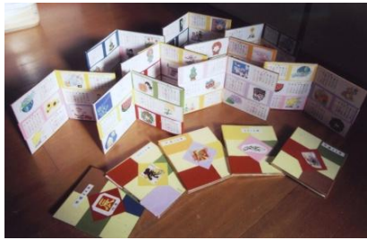
11 月 好評のカラクリカレンダーづくり