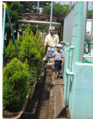
僕たちも空バケツ運びでお手伝い！

U字溝掃除9時30分からの作業開始でしたが、お母さん方とともに時間前から始めました。溝さらいはどんどん進みましたが、コンクリートのふたを開けるのがなかなか大変で、おじさんたち容易じゃなかった。終わってふたをする。腰が痛くなりそうだった。大勢のおかげで無事終了しました。今年はお父さんが来られなかったね。残念。終わって冷たいお茶をいただきましたが、子育て談義、鳥さんは先輩お母さんとして一言の重みを示していました。その点、男はダメだね、私は生まれの親だけだったなあ。(堀川)