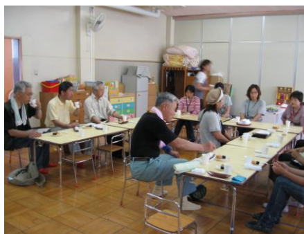
冷たいお茶をいただきながら子育て談義