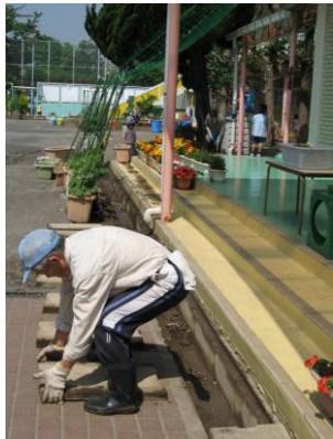
U字溝のふたが重かったなあ～

U字溝掃除9時30分からの作業開始でしたが、お母さん方とともに時間前から始めました。溝さらいはどんどん進みましたが、コンクリートのふたを開けるのがなかなか大変で、おじさんたち容易じゃなかった。終わってふたをする。腰が痛くなりそうだった。大勢のおかげで無事終了しました。今年はお父さんが来られなかったね。残念。終わって冷たいお茶をいただきましたが、子育て談義、鳥さんは先輩お母さんとして一言の重みを示していました。その点、男はダメだね、私は生まれの親だけだったなあ。(堀川)