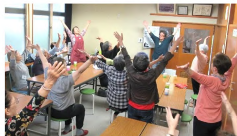
どなたでも自由に参加できます。 毎回20～30名の参加があります。