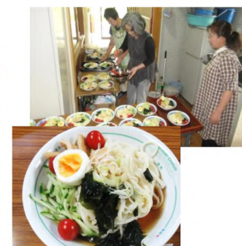
毎回軽食を用意。 今回は冷やしきつねうどん。