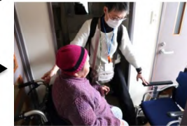
帰宅して室内用車イスへの移動介助