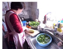
食材の下ごしらえ