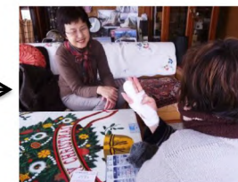
ケガの状況を確認