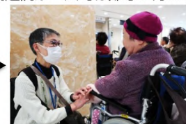
病院待合室で利用者と会話