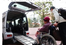
介護タクシーへの乗り入れを手伝う