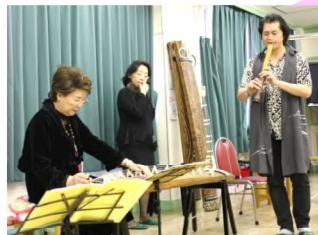
演奏会前の音合わせの様子