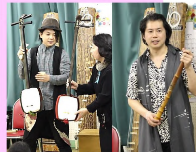
演奏のほか、曲の歴史や楽器の特徴などを説明します。