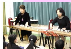
息の合った演奏で子どもたちも聞き入ります。