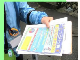
10:33 警察からのお知らせなどを配り防犯を呼びかけ