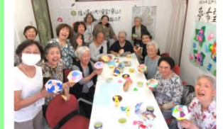
江戸川みまもり隊事務所では定期的に食事や工作などで地域の方との交流を図っています。