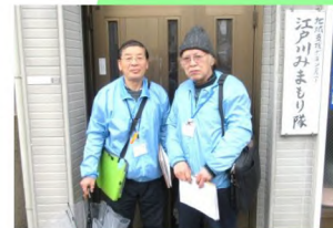
9:30 お揃いのウィンドブレーカーを着ていざ！みまもり隊出発！！