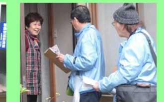
10:03 日常で変わったことがないか丁寧に伺います。