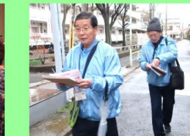
11:00 1回の活動で10件ほどみまもります。