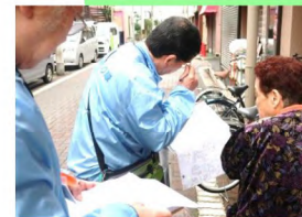
10:50 近所の方に、みまもり情報を街で聞き込みしています。