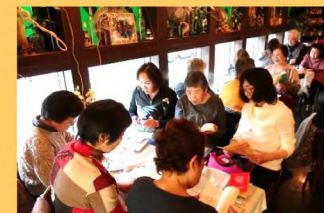
休憩時間は青春時代の頃の話に花が咲きます。