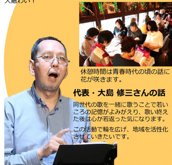
休憩時間は青春時代の頃の話に花が咲きます。