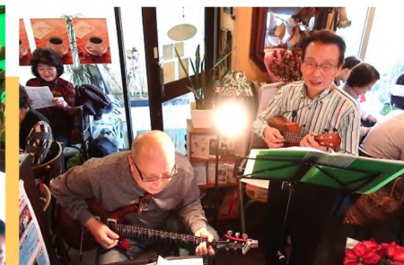
伴奏はエレキギター、ウクレレの生演奏