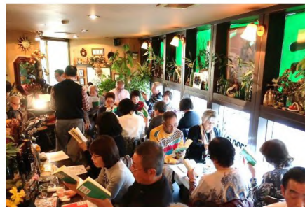
会場の喫茶店は人が通れないほどの大賑わい!