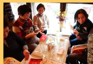
のどが乾いたらやっぱりレモンスカッシュ!